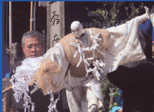
浄瑠璃人形遣い 勘緑